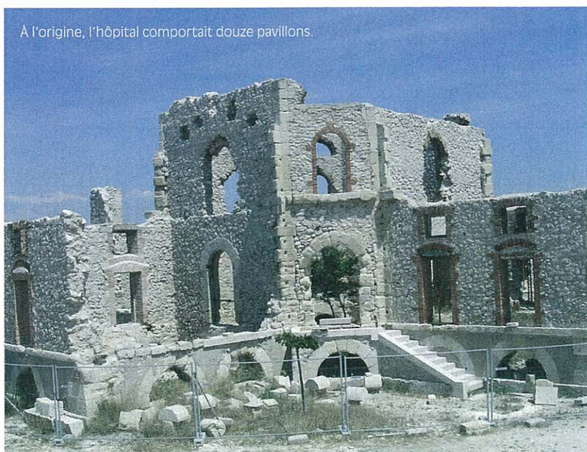
A l'origine, l'hôpital comportait douze pavillons.

La municipalité de Marseille a missionné l'association Acta Vista en décembre 2007 pour