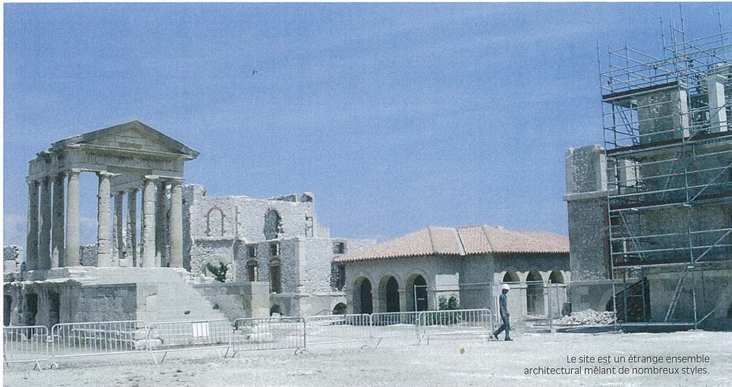
Le site est un étrange ensemble architectural mêlant de nombreux styles.

individus atteints par la maladie et tenter de les soigner – avec un succès très relatif –, il fut décidé de créer une unité médicale délocalisée. C'est ainsi que l'hôpital insulaire Caroline fut bâti, inauguré en 1828, ainsi baptisé en hommage à l'épouse du duc de Berry, Marie-Caroline de Bourbon-Sicile, princesse des Deux-Siciles. Ces édifices ont été inscrits à l'Inventaire supplémentaire MH par arrêté du 5 août 1980.