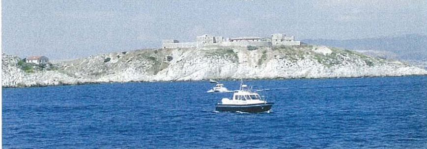
L'hôpital Caroline en 1897.

L'isolement de l'établissement, construit sur le promontoire d'un îlot désolé, visait à lutter contre le développement de la fièvre jaune dans le port.