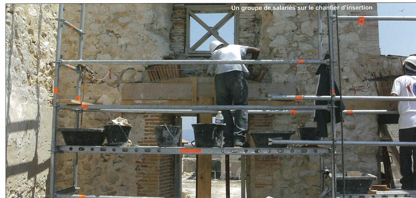
Un groupe de salariés sur le chantier d'insertion