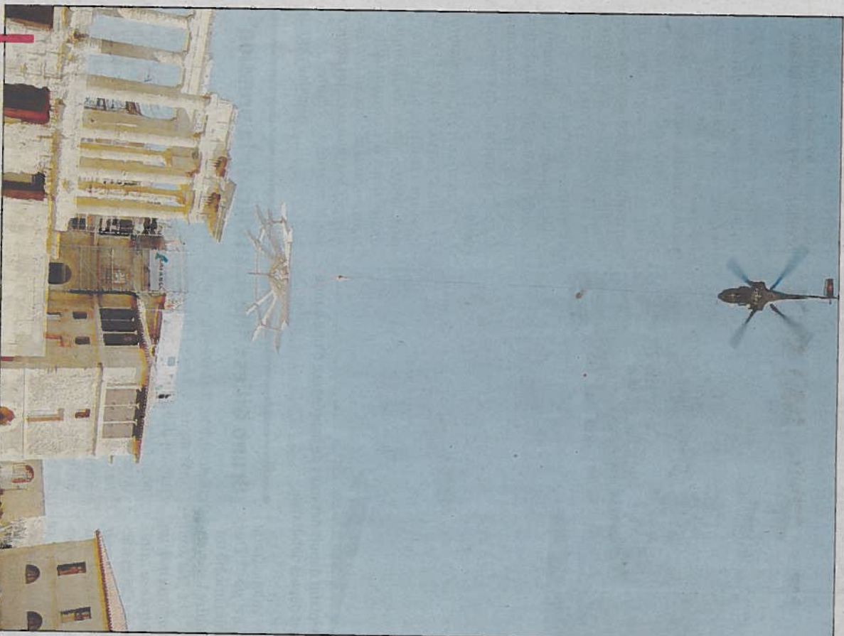
L'héliportage de l'imposante charpente de 6 tonnes et 12 mètres d'envergure s'est déroulé hier en fin de journée.

Dans le cadre de la restauration du monument historique, l'héliportage d'une charpente a été réalisé hier